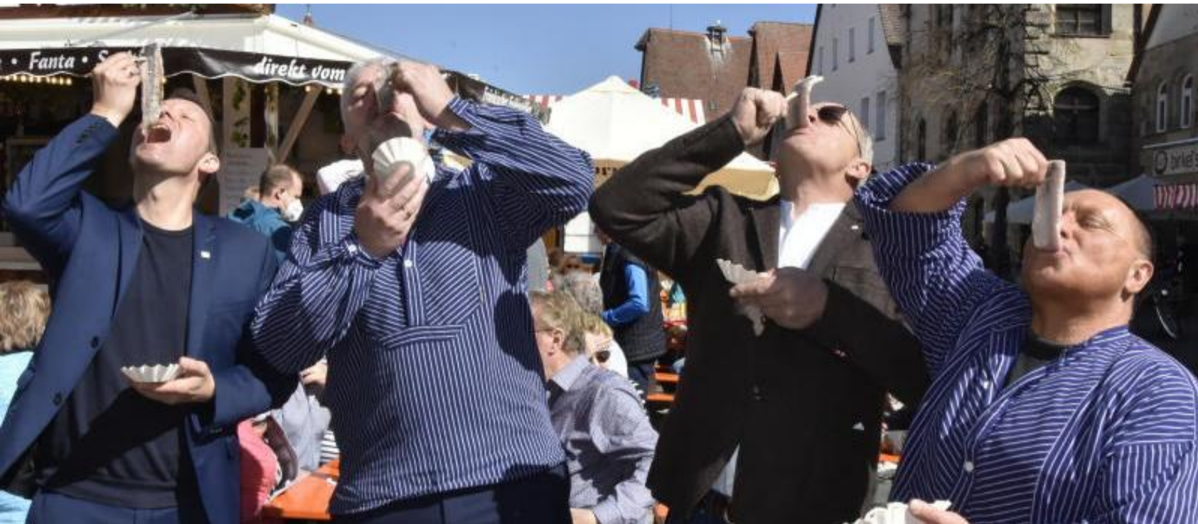
Die Stände sind am Mittwochmittag gut besucht, die Laufer freuen sich, dass in der Stadt wieder etwas geboten ist.

Die Schaustellerbranche ist nach langer Zwangspause wieder zurück – Fischmarkt geht noch bis Sonntag